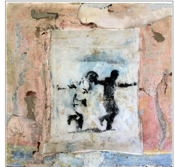
Dance with me - Affresco 100 cmm x 100 cm -2014