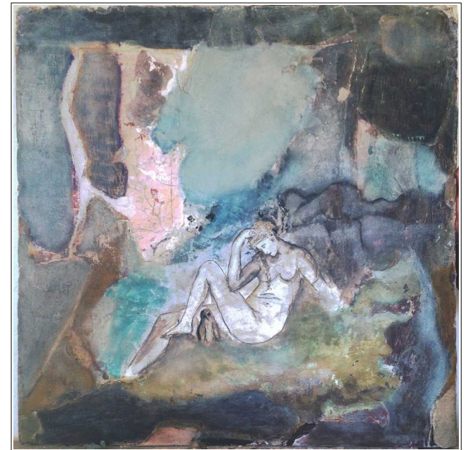
Athena - Affresco 100 cmm x 100 cm -2016